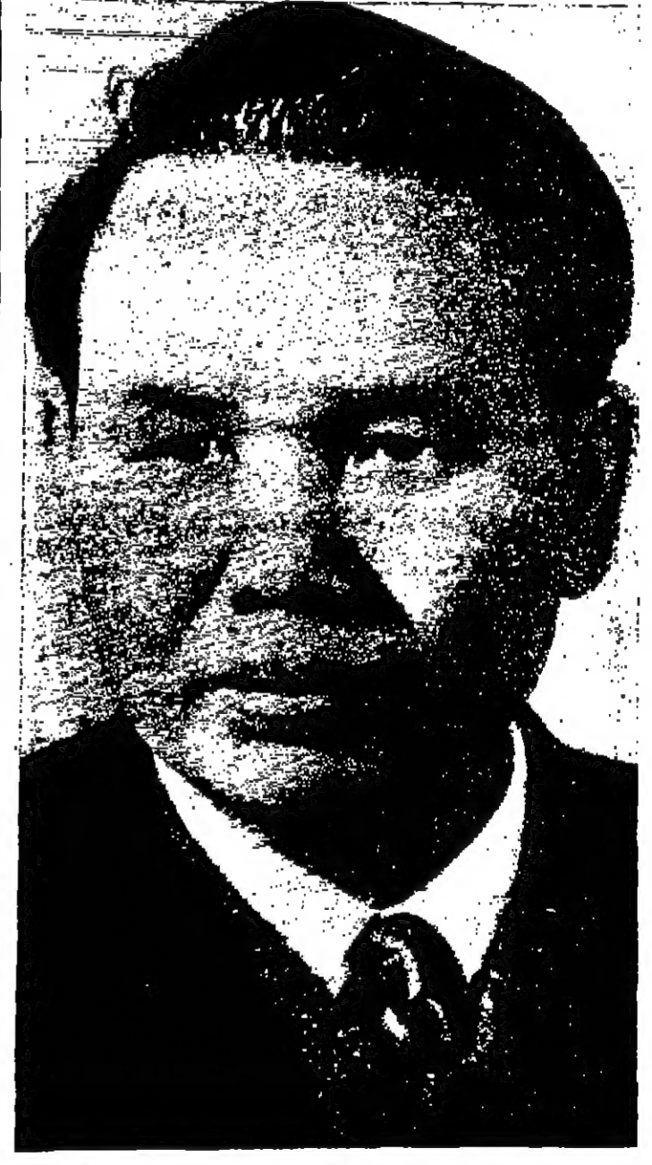
صورة من ارشيف اليوناني بريسكومون نوي الوزير القبطي اشميلي المنين ملاك كينام الشمالية في المخابرات الصهيونية مع الولايات المتحدة التي تقرر اجرائها في باريس يوم الجمعة القادم